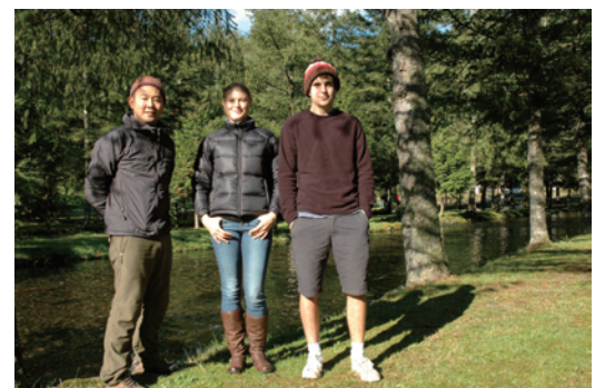
研究室の仲間と(Weaver Creek 鮭産卵場にて)