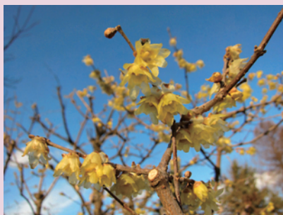
ソシンロウバイ(北白川試験地)