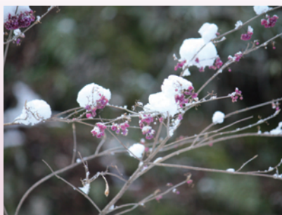
ヤブムラサキ(芦生研究林)