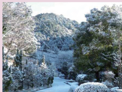
雪景色(徳山試験地 2月2日)