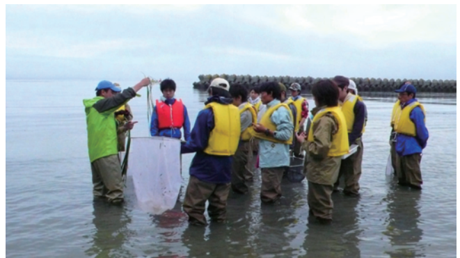
厚岸湾でアマモ場を観察する実習生たち(森里海連環学実習C)

(3) フィールド研と関わりの深い北海道、京都府、高知県の3ヶ所で、地元の人々と森里海連環学について学ぶ地域連携講座を開催しました。さらに2011年度には、東日本大震災の復興について森里海連環学の立場から考えるシンポジウムを