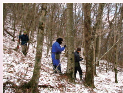
雪の中、二次林の毎木調査。尾根付近は 風が強く、冷たい。(和歌山研究林)