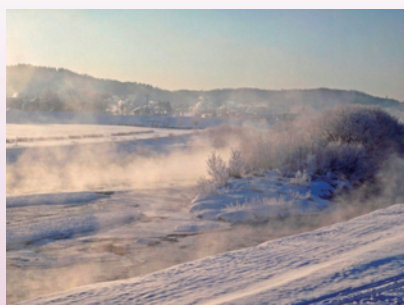
厳しい冷え込みにより釧路川で、けあらしが発生 (北海道研究林・標茶区)