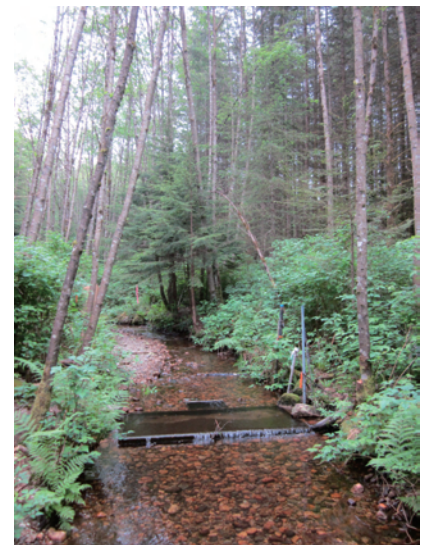
UBC MKRF の調査サイト

さて、UBCのあるバンクーバーは現在、冬真っ盛りで基本的に曇天です。フィールド生態学者を自称する私には、いささか欲求不満の貯まる日々です。しかし、森や川の生物たちが来たる春にむけてひそかに準備をしているように、私も学内での研究に集中しつつ、来たるフィールドシーズンに気持ちを繋いでいきたいと思っています。