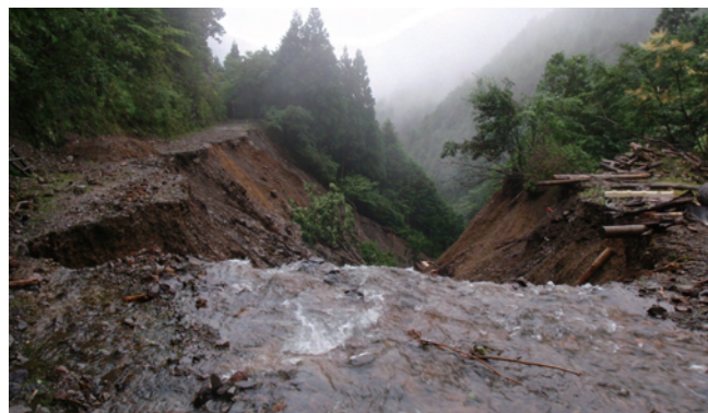
台風12号により崩落した土場

この多量の降水は研究林内を通る有田川の支流上湯川川の水位をあげ、林内で生じた土砂を川に運んだ。橋樑やカーブの部分で土砂が堆積し、流れが悪くなると水は林道にあふれ、林道 flowed。和歌山研究林は地形が急峻で道路の敷設には