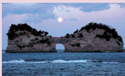
円月島上空・早朝の満月 (瀬戸臨海実験所 2月9日)