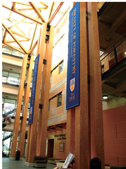
筆者の職場のある UBC Forestry Building

周辺の陸域の生物を対象にした様々な研究が展開されています。森林と河川のつながりを深く理解し、それを損なわない森林管理について考えたい私にとって、ここはまさに！という研究室です。実は、Johnの研究室で研究することは博士課程が終わる頃から何度か試みて失敗していたので、今回の渡航は念願がなって心躍るものでした。