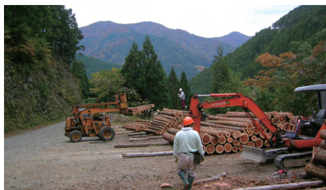
被害前の土場の様子

非常に苦勞しており、林内の幹線道路はほぼこの上湯川川に沿って設置されているため、今回の台風による降水は川を埋め、道路を流れ、削った。土場では下部がえぐられ崩壊を生じ、作業のため土場にあったショベルカーは崖下に転落した。被害があまりに大きく自力での復旧作業は非常に困難です。大きな災害は当研究林ばかりではなく、教育研究をめぐる状況も厳しい中、大変心苦しいですが、復旧のためのご支援をお願い申し上げます。