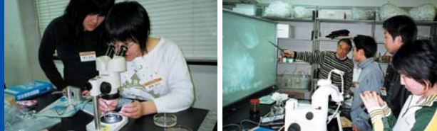
左：フィールド調査で採取したスズキの稚魚の頭から実体顕微鏡とピンセットを使って耳石を取り出す。 右：取り出した耳石を拡大映写して説明