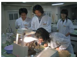
左：時計を動かす炭で作った電池の説明。 右：自分で作った太陽電池に光をあて、発電量を調べる。