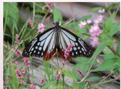
アサギマダラ（芦生）