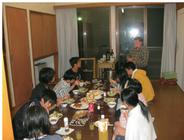
ニコル社会連携教授が我々の宿を今年も訪問。持参してくださったシカ肉スープに舌鼓をうちながらの夕食を食べ、その後もにぎやかでためになるディスカッションを楽しんだ（8月12日）