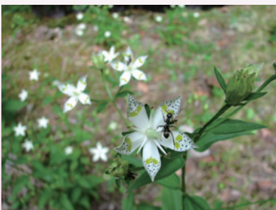
アケボノソウ。夏の終わり頃から秋にかけて林道沿いに、今年は特に多く見られた（和歌山）