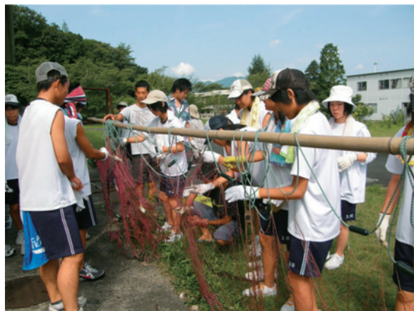
刺し網にかかった生物を取り外している様子

じさせるのか、初めのうちは網に引っかかった魚を外すのさえ尻込みしています。しかし、いったん慣れてしまうと、「くさい」を連発しながらも真剣に実習に取り組んでいます。