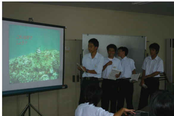
実習の成果を発表している高校生の様子

実習内容というのは、自然科学のごく限られた一面です。実習を通して研究することのおもしろさを感じ取り、将来、研究者を目指す学生が一人でも増えてくれることを願ってやみません。