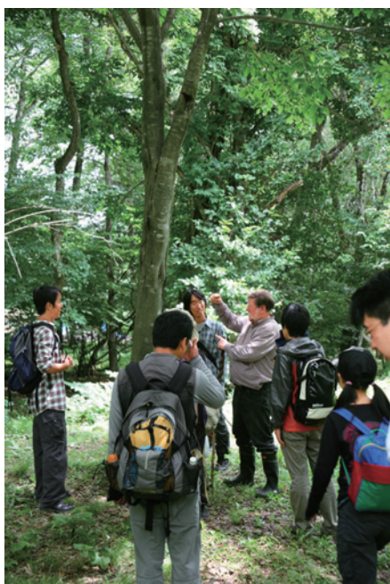
ニコル社会連携教授の案内でアファンの森を巡る（8月11日）