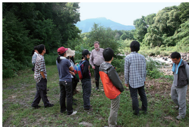
アファンの森事務所前の河原で治水に関する説明を受ける（8月11日）