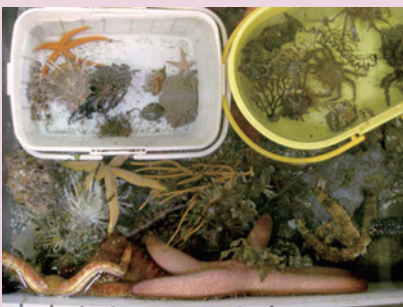
イセエビ刺網漁で混獲されたカニやヒトデなどの無脊椎動物。水族館の重要な収集源（瀬戸）