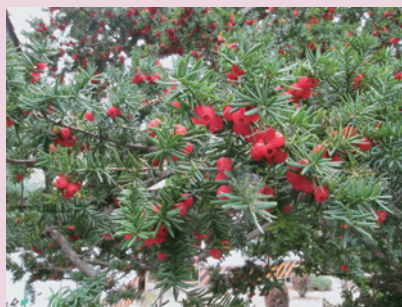
イチイの実（北白川）