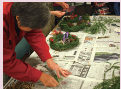
秋の観察会ネイチャークラフトの様子（上賀茂）