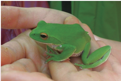
手乗りモリアオガエル (芦生研究林)