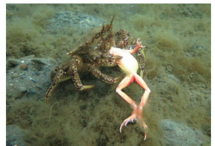
舞根湾奥にてカエルを捕食していたトゲクリガニ

一方、我々が調査を進める間にも、東北地方の沿岸では、巨大な防潮堤が築かれつつあります。森と海のつながりが分断されることのないよう、配慮が必要かと思えます。