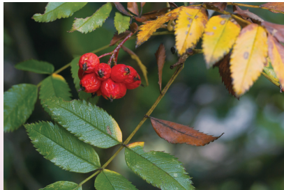
ナナカマドの実 (北海道研究林)