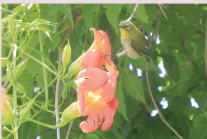
ノウゼンカズラの蜜を吸いに来たメジロ (北白川試験地)