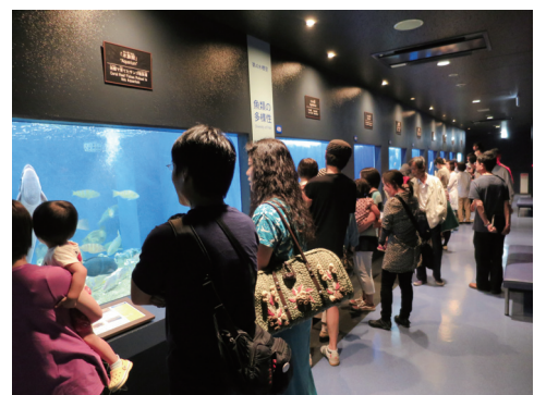
無料開放日の館内

今年の夏休み期間（7月19日～8月31日）の有料来館者数は21,310人で前年度比73%増と、例年以上に多くの方に来館いただきました。これからもできるだけ多くの方に来ていただけるよう、展示を充実させていきたいと考えています。