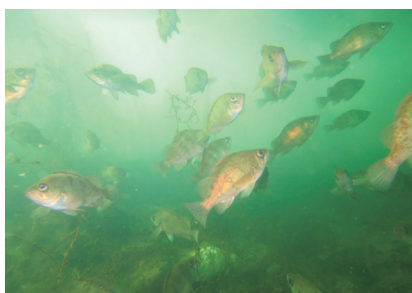
舞根湾のガラモ場に復活したシロメバルの群れ

津波から2ヶ月後の海底は、のっぺりと泥に覆われ、そこに少数の稚魚のみが散見されました。津波の激流により魚たちは押し流されて、陸上から運ばれた土砂が堆積し、津波発生時に卵や仔魚として沖合で漂っていたものだけが生き残り、沿岸にやってきたのでしょう。それから半年の間に魚の数は急激に増えましたが、この時期にはハゼ科のキヌバリがやたら