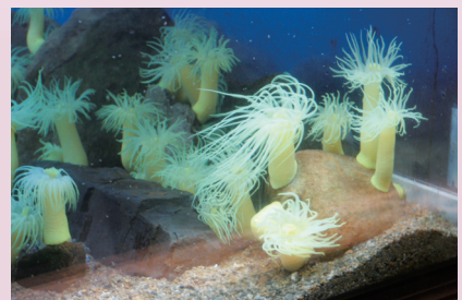
オオカワリギンチャク (白浜水族館)

http://fserc.kyoto-u.ac.jp/zp/nl/news34 この他にも季節の写真をご覧いただけます