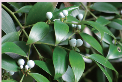
ナギの木と実 (徳山試験地)