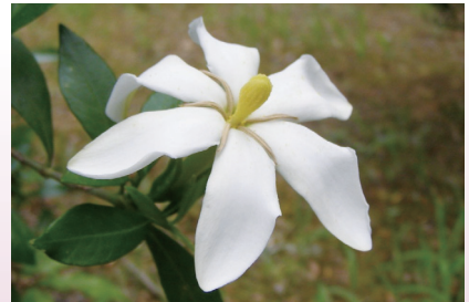
コクチナシの花 (上賀茂試験地)