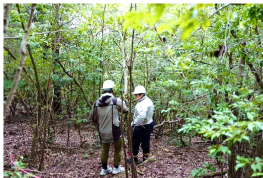
京大フィールド研上賀茂試験地における調査の様子