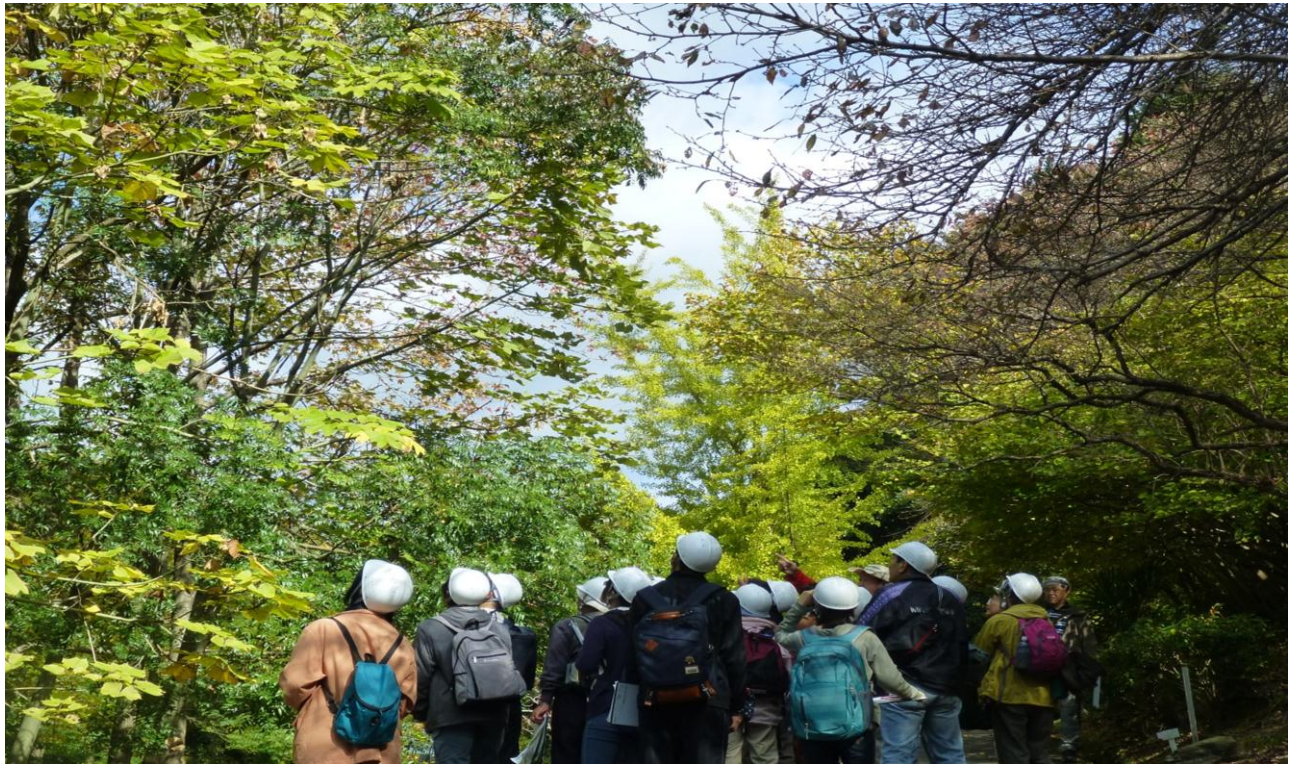
新旧試験地のフィールドを見学し、京都大学の森について学びます。